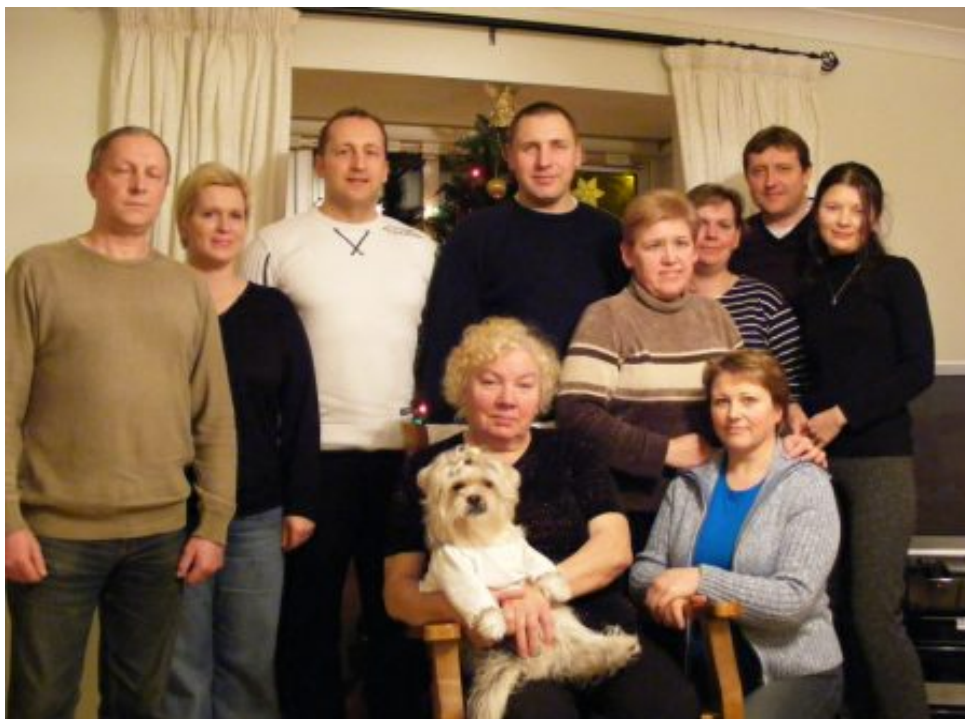
Lietuvių tikinčiųjų bendruomenė Airijoje